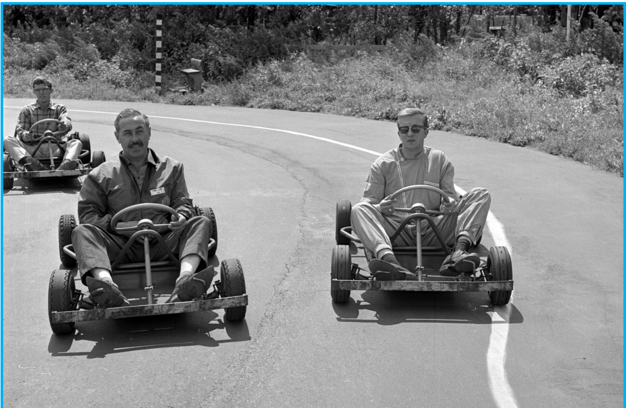
Links in de skelter mede-exploitant Oosterhout

Dat is jammer. Maar voor de Terbreggenaren is in de middaguren het plezier van de vrije zaterdag toch al voorbij: Want na elven kwetteren de vogels niet meer en houdt het groen op te geuren. Daarvoor in de plaats komt benzinstank en luid gegier en gebrul. Dan namelijk worden de skelters in de baan gebracht en begint het onophoudelijk rondjes rijden op het parcours, dat een maand of twee geleden werd aangelegd op een voormalig voetbalterrein achter de Ommoordseweg. Tot zonsondergang gieren de karretjes in het rond. Hier en daar worden ramen en deuren gesloten; men sluit de zon maar ook het lawaai en de stank buiten. In de tuintjes schuift men tafeltjes en ligstoelen weer bij elkaar en gaat men