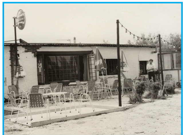
Café De Witte Hoepel

Het was de vraag of de beperkte exploitatie (overtredingen van de beperkingen zouden worden bestraft met 250 gulden boete) lang zou kunnen voortduren, want er was ook nog een procedure gaande over het al dan niet toepasselijk zijn van de Hinderwet.