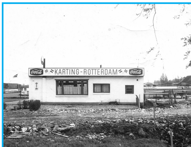
De Witte Hoepel droeg de naam van de skelterbaan

De omwonenden hadden een actie gevoerd om deze baan vanwege de last die men van de motoren ondervond, te doen sluiten. Zij hadden zich daarbij zelfs van een raadsman voorzien, die de bezwaren van de bewoners van bij de skelterbaan gelegen huizen aan de Kroon had voorgelegd. Reeds eerder is deze baan een strijdpunt tussen de exploitant en de bewoners geweest. Toen hadden de bewoners in kort geding een uitspraak van de rechter gekregen, waarbij deze rechter weliswaar niet besliste tot sluiting van de baan, maar waarbij enkele beperkende maatregelen aan de eigenaar en de skelterrijders werden opgelegd. Niettemin bleven de omwonenden vooral in de avonduren en gedurende de weekeinden zoveel last