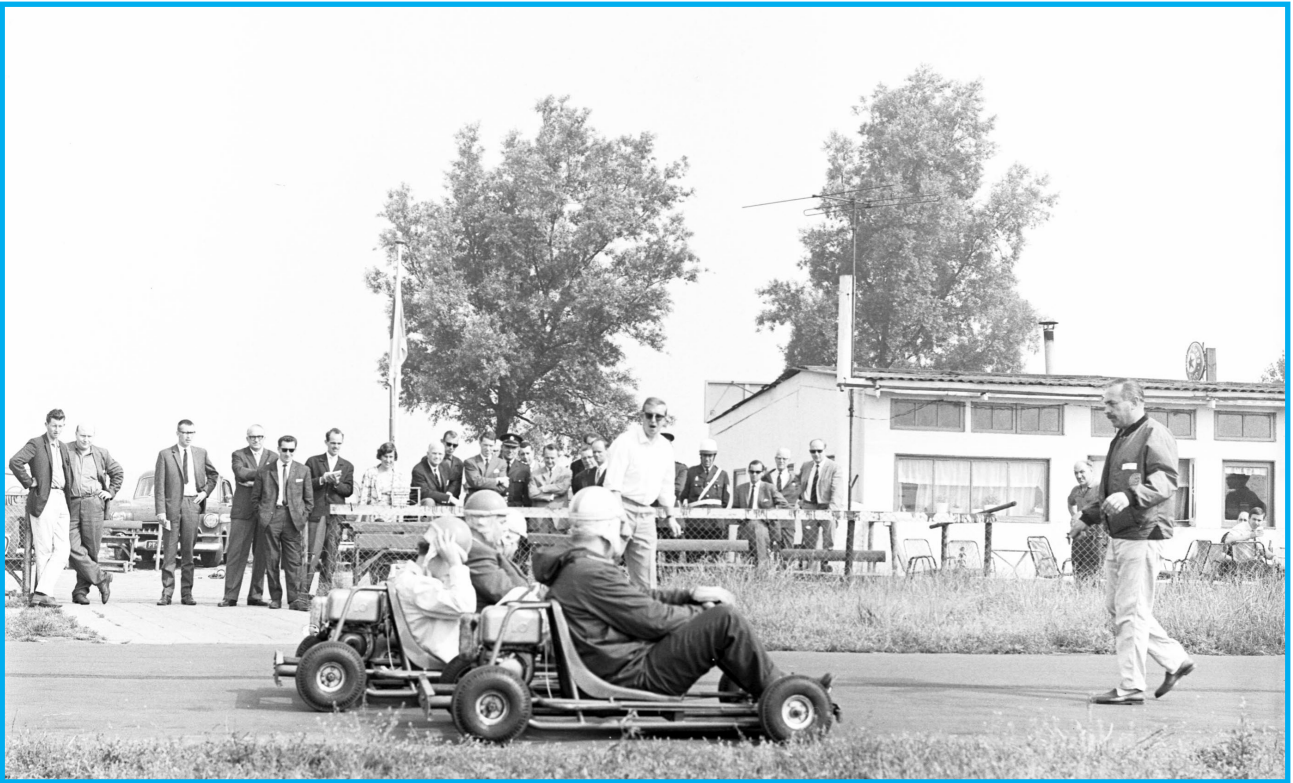
De skelterbaan met café de Witte Hoepel

binnen verder lezen in krant of boek. En in alle huizen op de Terbregseweg en de Ommoordseweg, die de skelterbaan omsluiten, wordt thans onvriendelijk commentaar geleverd, zoals bij voorbeeld de makelaar W. Brons van de Ommoordseweg doet.