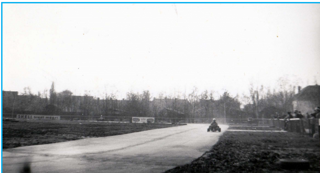
De skelters veroorzaakten veel lawaai, aldus omwonenden