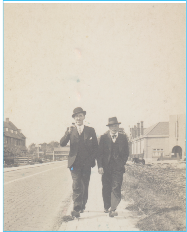
Let op de schoorstenen op het dak van de school

Er verscheen een groot zeildoek aan het pand met daarop de tekening hoe een geïnteresseerde projectontwikkelaar het had gedacht: foeilelijk in de ogen van vele Terbreggenaren. Het doek werd weer weggehaald en iedereen ging weer rustig slapen. Een nieuwe gegadigde, Burgland Estates met Kolpa architecten heeft